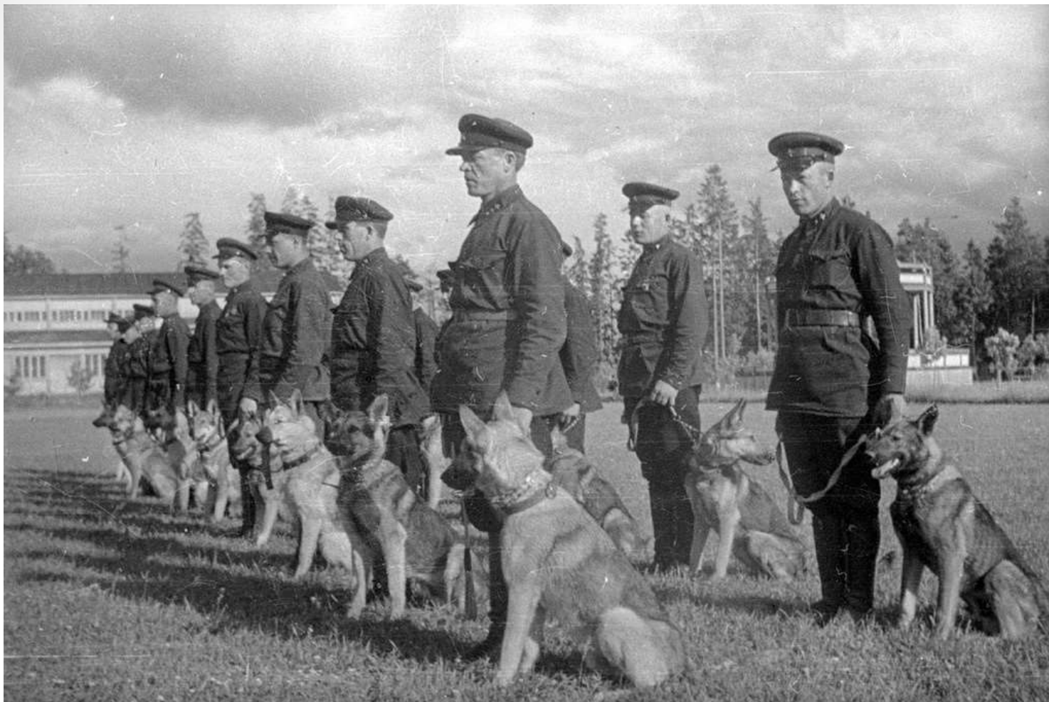
Пограничники с собаками.