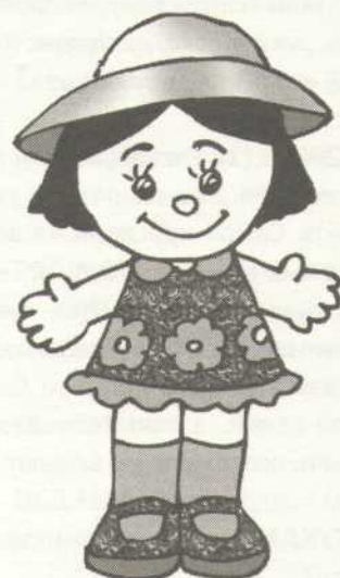
Рис. В. Черняевой

КУКЛА (3): Девочки, вы только посмотрите, как вокруг чудес-