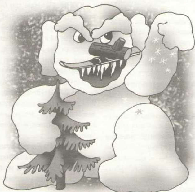
Рис. В. Черняевой

дитесь! Это же и детей, надо воспитывать.