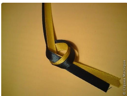
Рис1. Связываем одновременно две ленты узлом, оставляя с одного конца по 5 сантиметров