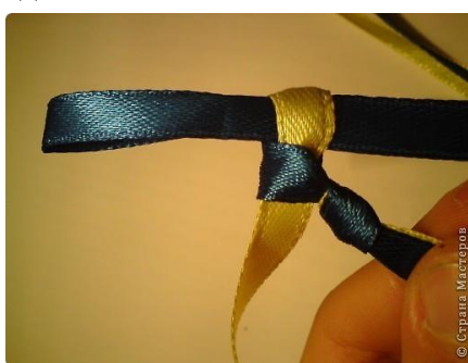
Рис 6. Делаем новую петельку и протягиваем ее через ту петлю, которая осталась. Опять подтягиваем петлю, только не сильно, так как она должна остаться шире, чем сама лента. Все остальные действия проделываем в той же последовательности.

Рис7. Когда мы дошли до нужной длины, конец ленты вставляем в петлю и связываем ленточки между собой.