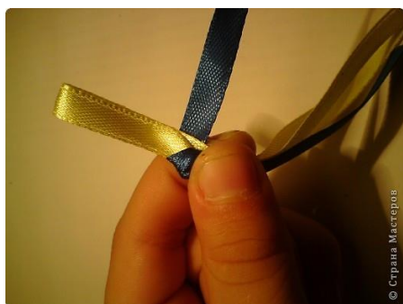
Рис 4. Черную петельку вводим в желтую

Рис 3. Черной лентой, которая у нас сверху, обвиваем желтую и делаем из нее петлю.