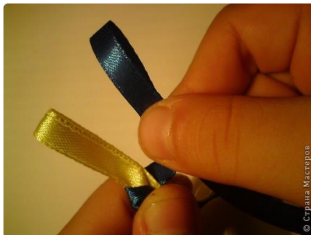
Рис 5. Более длинный конец желтой ленточки, немного подтянем. А черную ленточку протянем вперед, чтобы она стала длиннее.