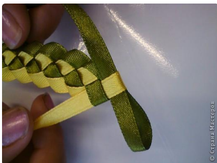
Рис7. Когда мы дошли до нужной длины, конец ленты вставляем в петлю и связываем ленточки между собой.

Рис 6. Делаем новую петельку и протягиваем ее через ту петлю, которая осталась. Опять подтягиваем петлю, только не сильно, так как она должна остаться шире, чем сама лента. Все остальные действия проделываем в той же последовательности.